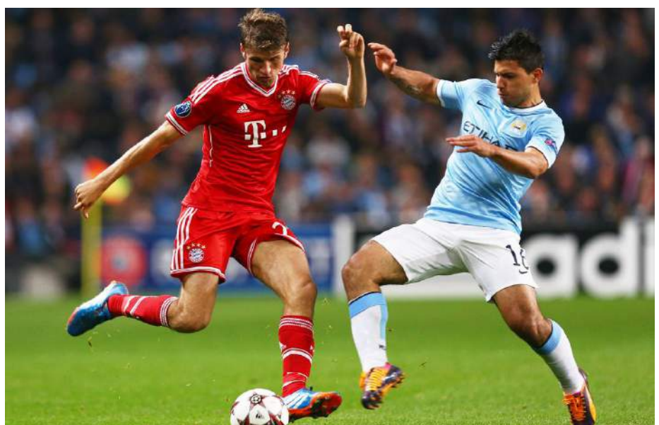
Bayern y City volverán a la guerra por ser primeros.