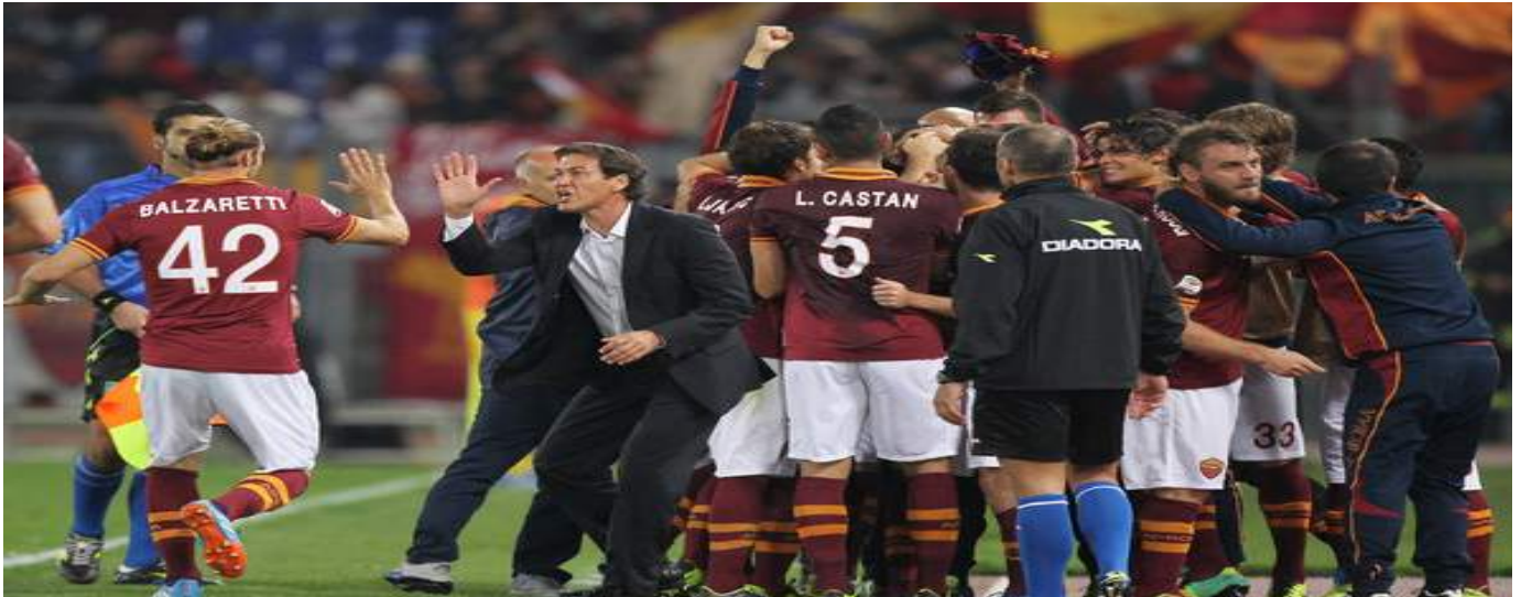
El conjunto de la capital plantó cara a la Juventus hasta casi el final de temporada.