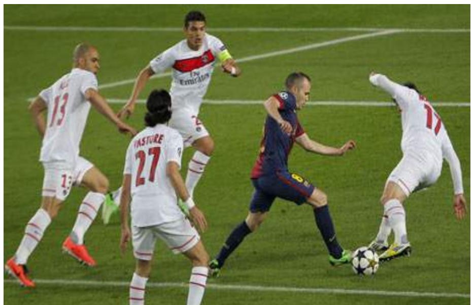
El PSG empieza a tener obligación por ganar debido al coste de la plantilla.