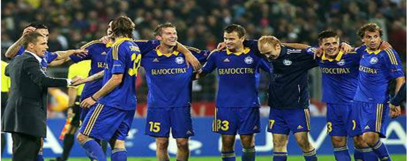
El equipo bielorruso es claramente la “cenicienta” del grupo..