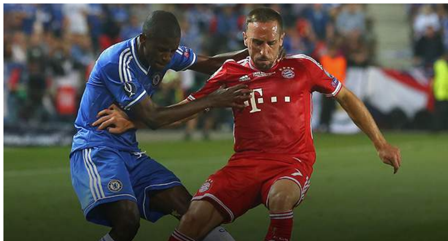
Bayern de Múnich y Chelsea son los equipos europeos (no españoles) con mayor potencial del viejo continente.

El trono que ahora sustenta el Real Madrid será codiciado por un ramillete de casas europeas entre las que destacan las otras tres finalistas de la pasada edición. El anterior