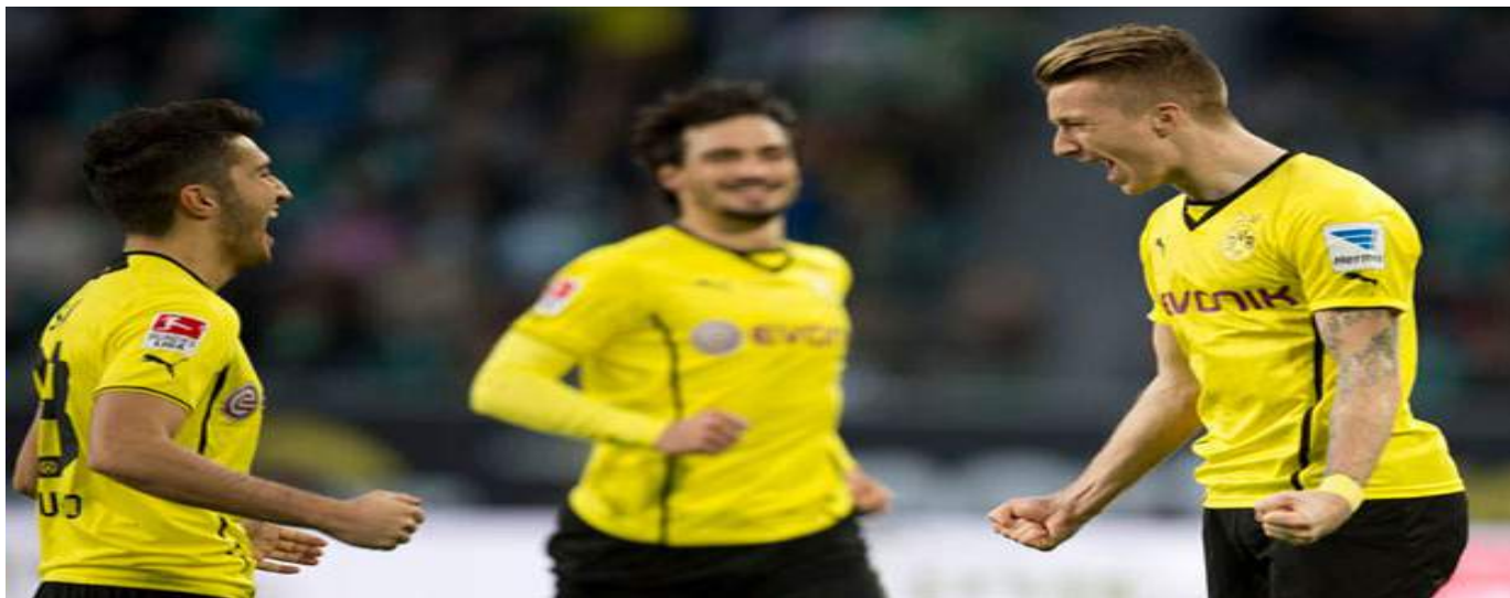
El equipo alemán intentará repetir la hazaña de 2013 donde consiguió meterse en la final.