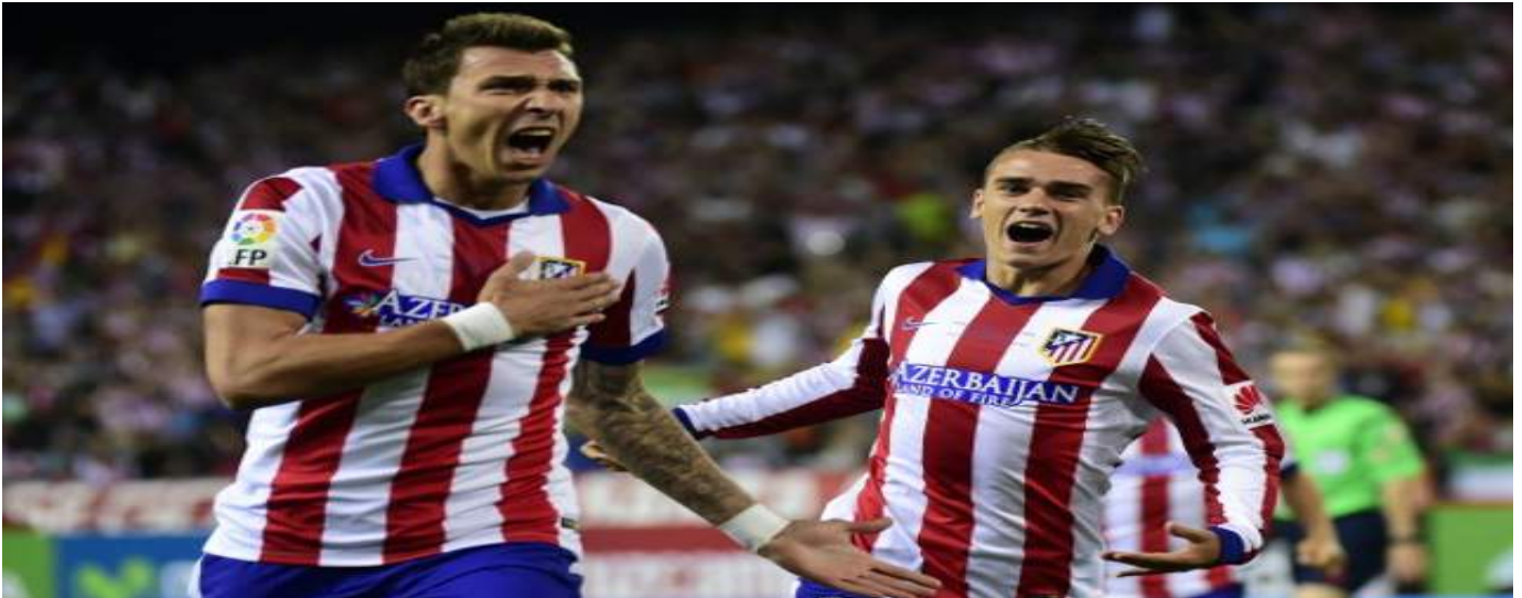
Mandzukic y Griezmann forman la dupla goleadora de este nuevo Atlético de Madrid.