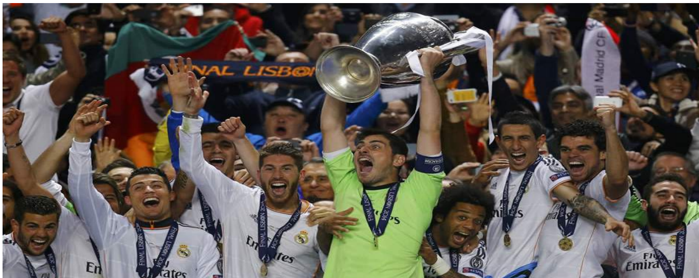
El equipo blanco se hizo con la Décima tras derrotar en la final al Atlético de Madrid.