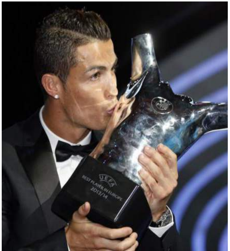
Cristiano Ronaldo besa el trofeo de ganador.

El luso realizó una de sus mejores campañas donde fue bota de oro de la Champions