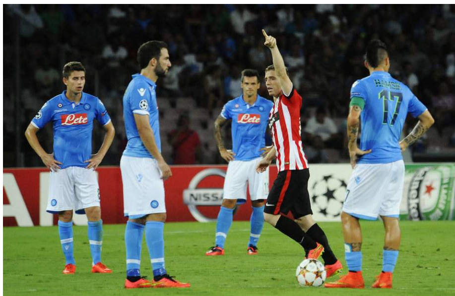
El Athletic hizo hincar la rodilla al Nápoles en la fase previa.