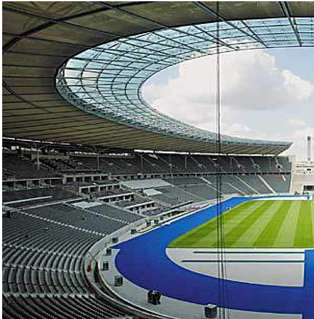
Fue la gran construcción realizada por Adolf Hitler para mostrar su hegemonía

En estos Juegos, Adolf Hitler buscaba que sus atletas fueran los triun-