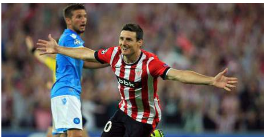
El Athletic de Bilbao regreso a la competición tras 16 años de ausencia y de dejar en la cuneta al Nápoles italiano que dirige Rafa Benitez.

el fin de ciclo que vive la entidad azulgrana.