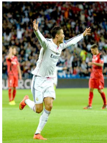
CR7 fue la estrella del choque.