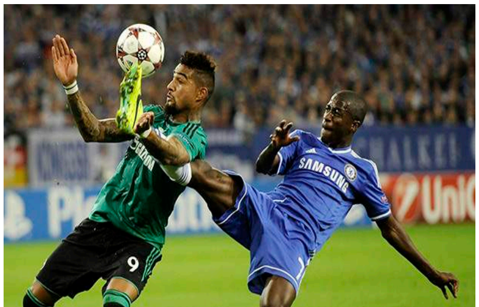
El Chelsea esta obligado a ser primero de grupo.