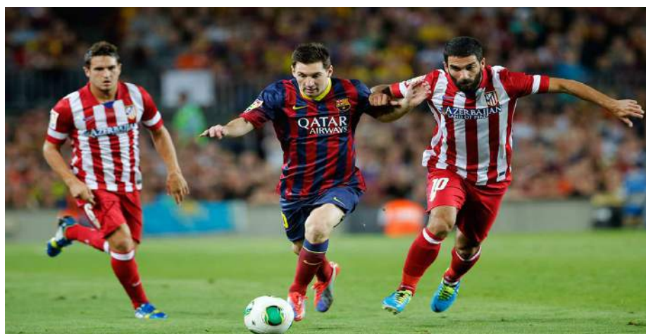
Barcelona y Atlético de Madrid volverán esta temporada a poner muy cara su derrota en la máxima competición de clubes europeos.

campeón, el Bayer de Múnich, fue eliminado en semifinales por el Real Madrid la pasada campaña y en esta edición buscará venganza. Para ello y a pesar de haber perdido a un hombre fundamental como con Kroos, el equipo alemán mantiene el bloque que lidera Guardiola desde el banquillo y que destaca por un fútbol de posesión y ataque. Aunque ya es una máquina bien engrasada, el estratega catalán ha decidido reforzar todas las zonas del campo. Así, la defensa mejora