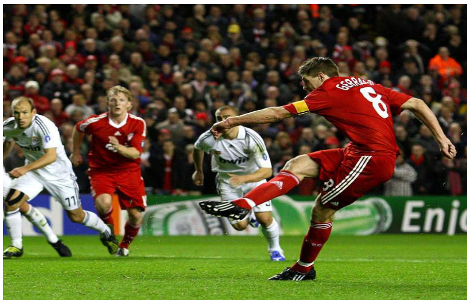
La eliminatoria del chorro fue una gran afrenta para el Real Madrid.