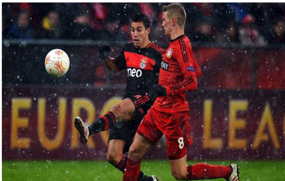
Los equipos del grupo ya se han visto las caras en anteriores ediciones.