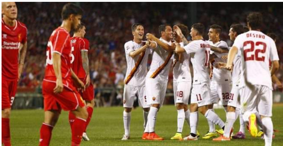
Roma y Liverpool vuelven a la competición, tras años de ausencia, donde se echará en falta a Manchester United y Milán.