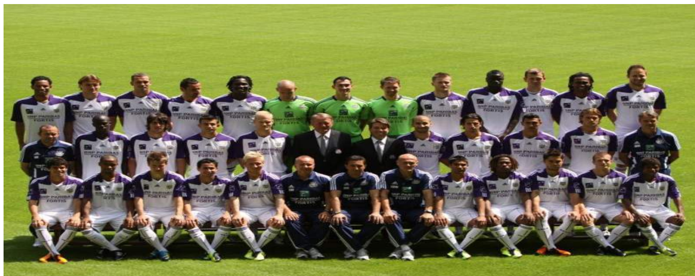
El nivel del equipo belga está muy por debajo de sus compañeros de grupo.