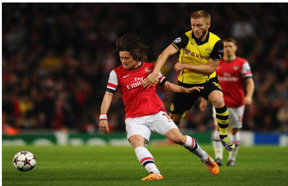
Ingleses y alemanes pelearán por el primer puesto del grupo.