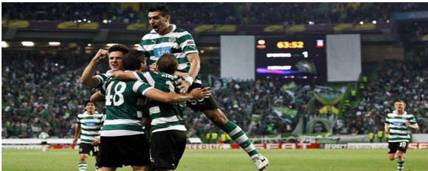
El equipo quedó segundo en la liga portuguesa colándose entre Benfica y Oporto.