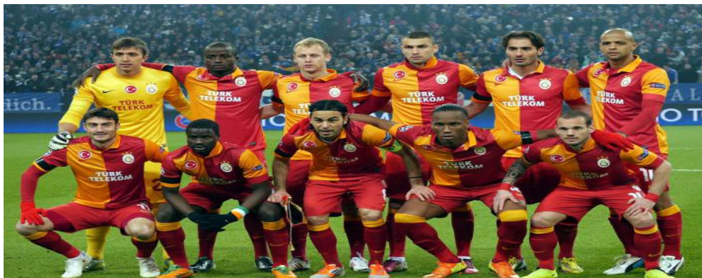
el Galatasaray debe aprender a vivir sin la relevancia de su anterior estrella, Didier Drogba.