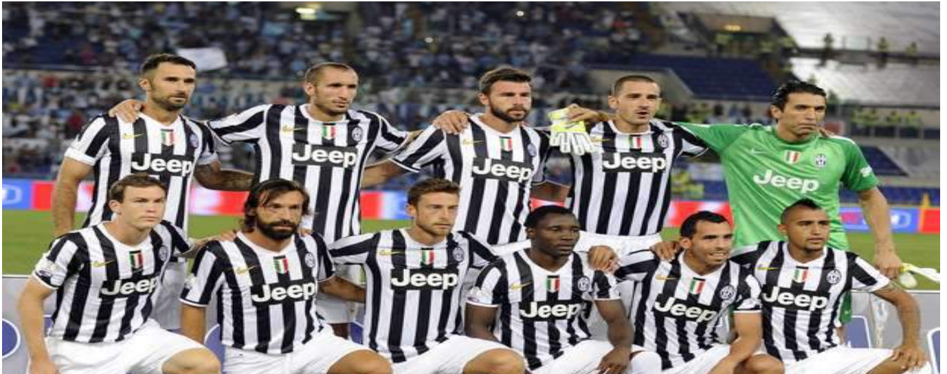
El equipo italiano lleva desde 1996 sin ganar el título.