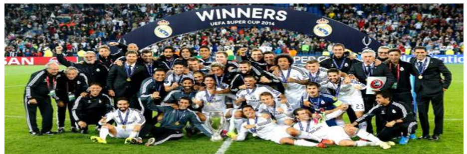
El Real Madrid vuelve a levantar el título tras el logrado en 2004.

A pesar de ello, fue una contra liderada por Bale y culminada por Cristiano la que dio ventaja al descanso, para ser el portugués en la reanudación quien sentenciará el choque. A partir de ese momento el Real Madrid se dedicó a dormir el partido ante una cierta pasividad sevillana que poco inquieto la meta de un Iker Casillas salvó una gran disparo de Carriço. Él fue un espectador más de la Supercopa de Europa que se convierte en el primer título del Real Madrid 2014-2015 del técnico italiano Carlo Ancelotti.