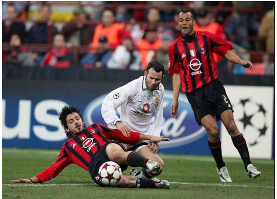
La crisis deportiva se ha instalado en Milan y Manchester.

Pero, no todo son malas noticias ya que dos históricos como Roma y Liverpool vuelven a la máxima