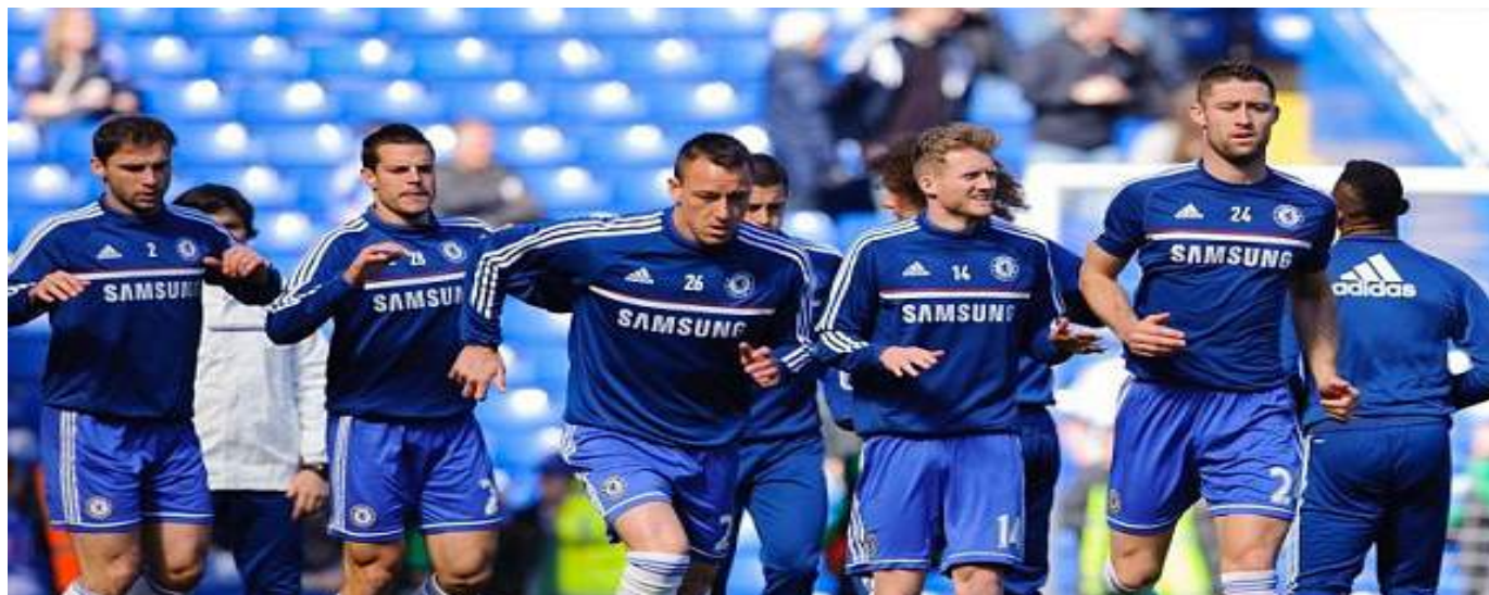
El juego aéreo debe seguir siendo una de las armas del equipo.