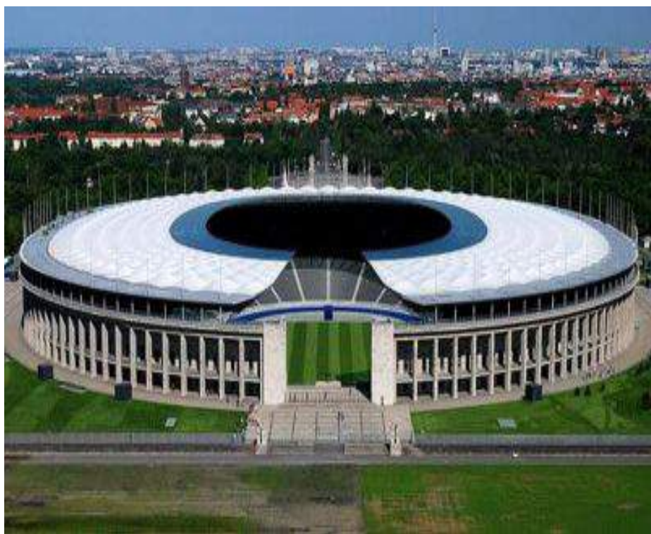
Es el estadio nacional de Alemania.

Por ello, Hitler estuvo muy implicado en el proyecto del arquitecto Werner March cuyo estadio debía