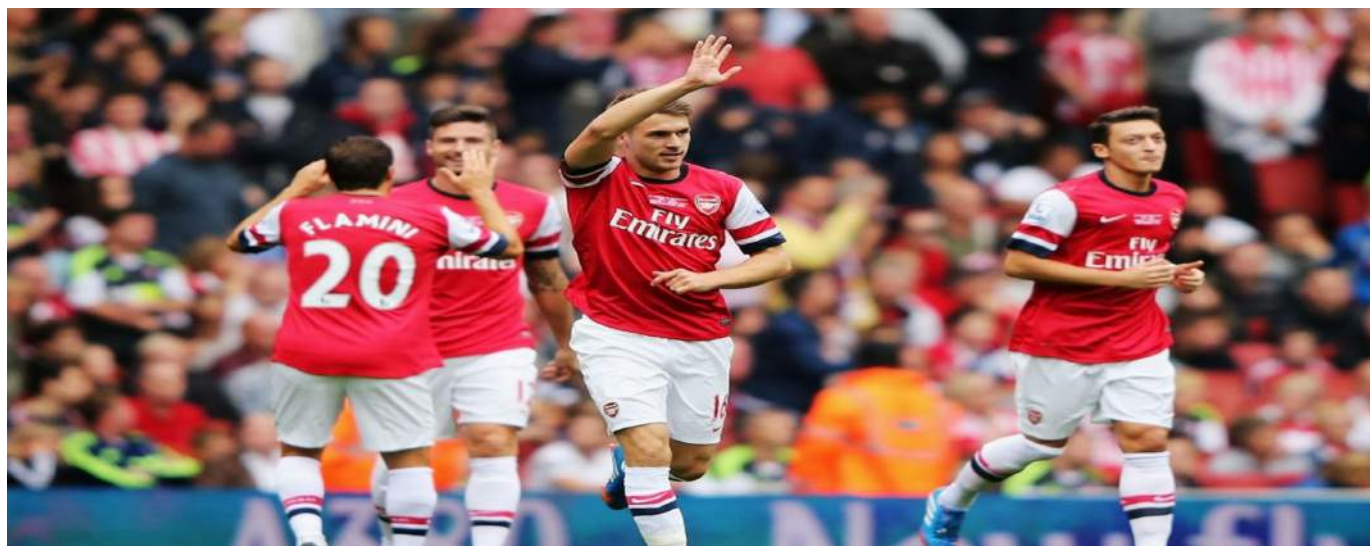
Ramsey, Ozil o Alexis Sánchez son algunos de los jugadores con los que cuenta el equipo.