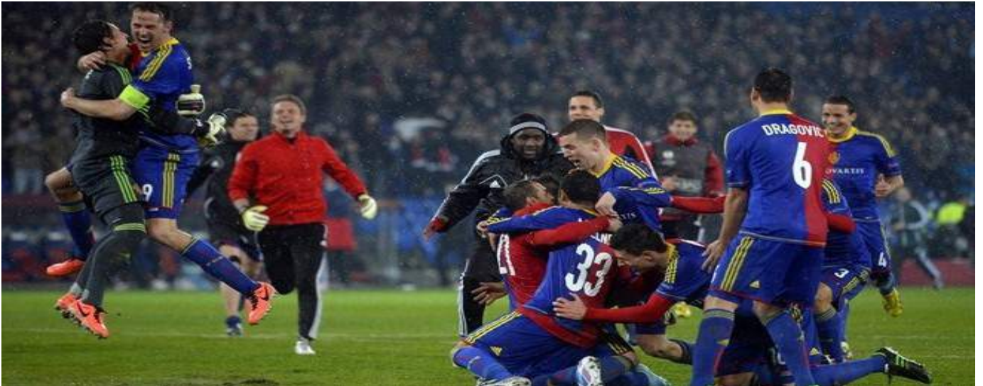
El Basilea ha crecido mucho durante las últimas campañas.